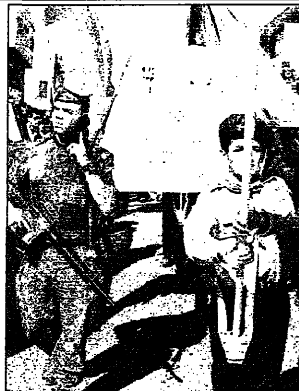
اطفال الخليل في مسيرة بمناسبة عيد الاستقلال الفلسطيني